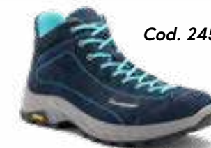
Cod. 2456 (W)